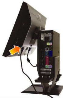
5 Connect the power cable firmly to the monitor as shown

將藍色模擬(VGA)線纜連接到電腦上。 將藍色模擬(VGA)線纜連接到電腦上。 青いVGAケーブルをコンピュータに接続します 청색 VGA 케이블을 컴퓨터에 연결합니다. เชื่อมต่อสายเคเบิล VGA สีน้ำเงินเข้ากับคอมพิวเตอร์