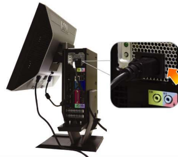
6 Connect the power cable firmly to the computer as shown

將電源線連接到顯示器（如圖所示） 請連接顯示器電源線（如圖所示） 図のように、電源ケーブルをモニターに接続します 전원 케이블을 아래와 같이 모니터에 연결합니다 เชื่อมต่อสายไฟกับจอภาพ ตามรูป