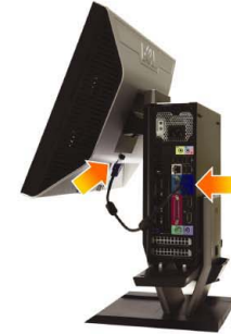
4 Connect the blue VGA cable to the computer

使計算機連接到支架自動鎖定裝置 使電腦連接到支架自動鎖定裝置 コンピュータをスタンドの自動ロック機構にかみあわせます。 컴퓨터를 스탠드 자동 잠금 장치에 고정합니다 ยึดคอมพิวเตอร์เข้ากับกลไกการล็อกอัตโนมัติของขาตั้ง