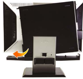
2 Slide the computer onto the stand

將顯示器連接到支架上 將顯示器接上支架 モニターをスタンドに取り付けます モニタ를 스탠드에 부착합니다 ต่อจอภาพกับขาตั้ง