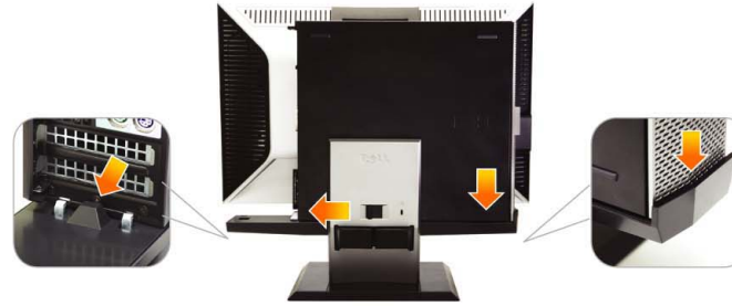
3 Engage the computer to the stand auto locking mechanism

推動計算機，使其滑行至支架上 將電腦推至支架上 コンピュータをスタンドにスライドさせます 컴퓨터를 스탠드에 밀어 넣습니다 เลื่อนคอมพิวเตอร์ เข้าล็อกกับขาตั้ง