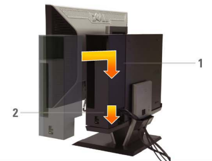
8 Connect the power cables to an outlet. Install the cable cover

將USB、鍵盤和鼠標線連接到電腦（如圖所示） 請將USB、鍵盤以及滑鼠線連接到電腦（如圖所示） 図のように、USB、キーボード、マウスケーブルをコンピューターに接続します USB 케이블, 키보드 케이블, 마우스 케이블을 아래와 같이 컴퓨터에 연결합니다 เชื่อมต่อสาย USB แป้นพิมพ์ และเมาส์ กับคอมพิวเตอร์ ตามรูป