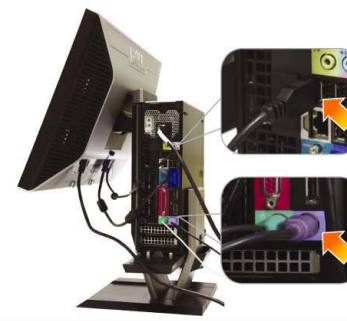
7 Connect the USB, keyboard and mouse cables to the computer as shown

將電源適配器可靠地連接到電腦（如圖所示） 請將變壓器確實連接至電腦（如圖所示） 図のように、電源ケーブルをコンピューターにしっかり挿入する 전원 어댑터를 아래와 같이 컴퓨터에 단단히 연결합니다 เชื่อมต่ออะแดปเตอร์ไฟ กับคอมพิวเตอร์ให้แน่น ตามรูป